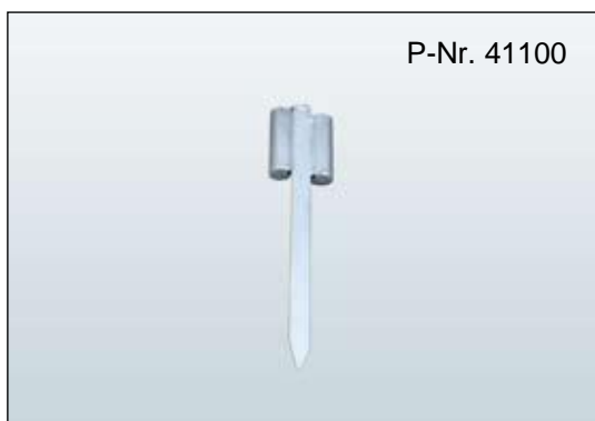
Rohrfuß Typ M zum Einschlagen Rohr Ø: 45 mm, Länge: 600 mm, Gewicht: 2,8 kg