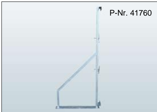
Sichtschutzzaunfuß Typ MH Höhenverstellbar, B/L/H: 120x860x1890–2300 mm, Gewicht: 17 kg