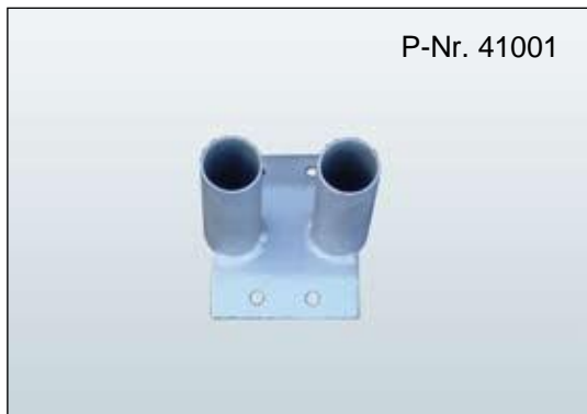
Flachfuß Typ N mit Rohr zum Aufdübeln, B/L: 160 x 130 mm, Gewicht: 1,7 kg