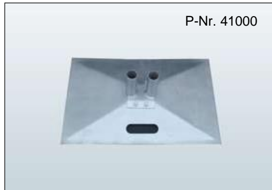
Flachfuß Typ A mit Rohr B/L: 500 x 740 mm, Gewicht: 13,8 kg