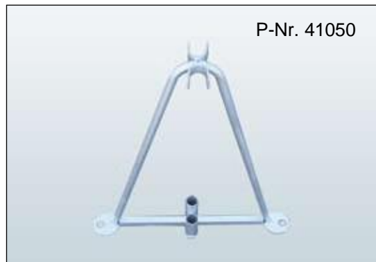
Dreieckfuß Rohr Ø 27 mm, B/H: 760 x 850 mm, Gewicht: 5,1 kg