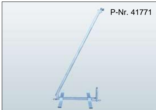
Sichtschutzzaunfuß Typ BM B/L/H: 195 x 1200 x 1750 mm, Gewicht: 13,6 kg,