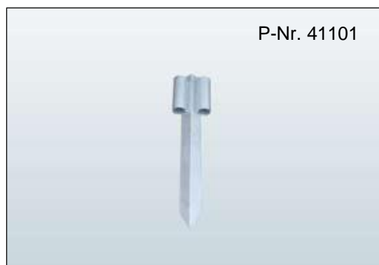
Rohrfuß Typ B zum Einschlagen Rohr Ø: 45 mm, Länge: 600 mm, Gewicht: 3 kg